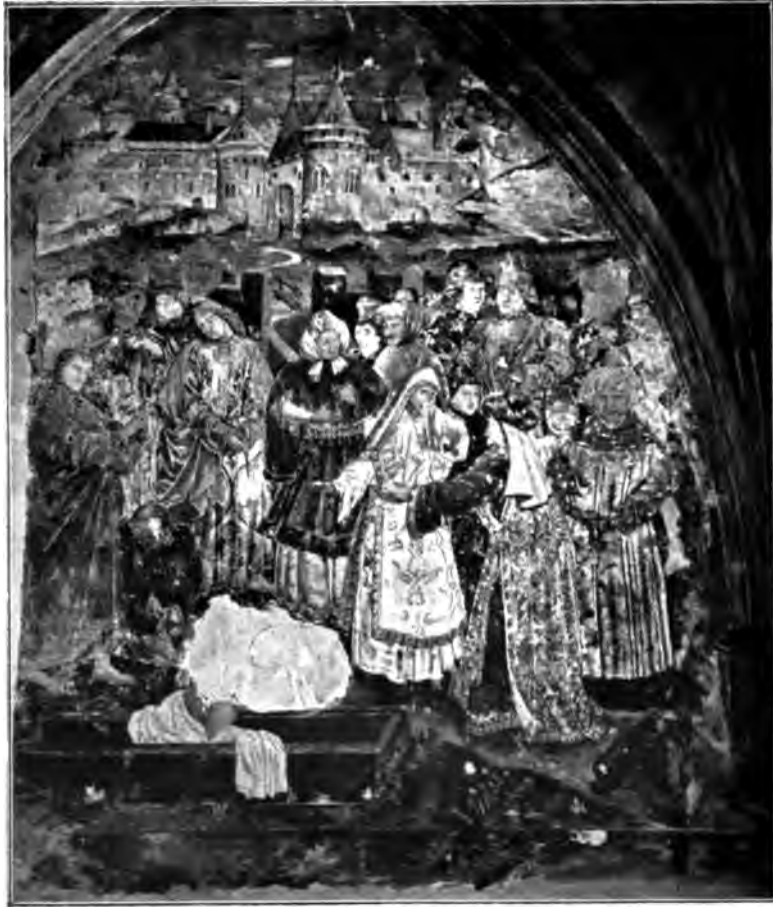
La Résurrection de Lazare (peinture murale de l'église Notre-Dame).

Sœur et contemporaine de Saint-Lazare d'Autun, aïeule de Saint-Philibert de Dijon, elle a le même mode d'éclairage et de couverture.